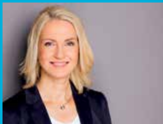
Manuela Schwesig Ministerpräsidentin des Landes Mecklenburg-Vorpommern