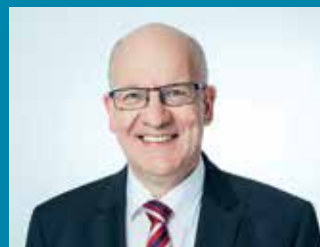
Roland Methling Oberbürgermeister der Hanse- und Universitätsstadt Rostock